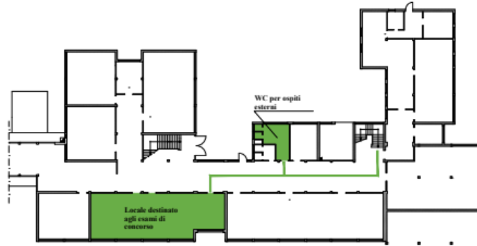
PIANTA PIANO SEMINTERRATO